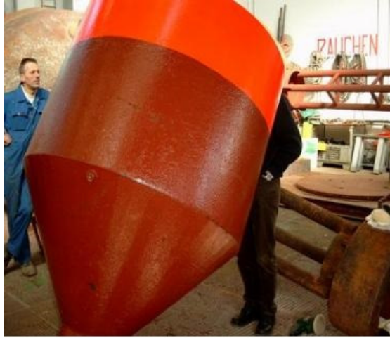
Bojen Beschichtung für das Wasser- und Schifffahrtsamt Cuxhafen - Bojen können auf See leicht von Belag befreit werden und müssen nicht mehr in die Werft