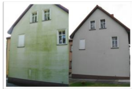
Fassade vorher und nachher