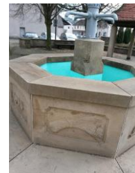
nach 10 Tagen

GreenEX ist ein ganz leichter Desinfektionswirkstoff, der einmal aufgetragen bis zu 12 Monate lang die Oberfläche leicht desinfiziert und dadurch Mikroorganismen abtötet. Nach wenigen Tagen zersetzen sich die abgestorbenen Mikroorganismen und die Oberfläche (egal welches Material) wird nach und nach sauberer. Die Oberfläche reinigt sich dadurch von selbst, ein abschrubben oder abspülen mit Hochdruckgeräten ist nicht mehr notwendig. Die effektiven Wirkstoffe, die bei einer bestimmungs-gemäßen Anwendung auf der Oberfläche bleiben (Langzeitschutz) sind dabei absolut unbedenklich gegenüber dem Material und das von Anfang an.