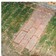
Pflasterfläche behandelt und unbehandelt