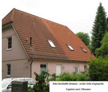
linke Dachhälfte belassen - rechte Seite eingegrüht. Ergebnis nach 3 Monaten