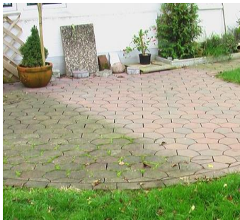
Pflaster nach 3 Monaten