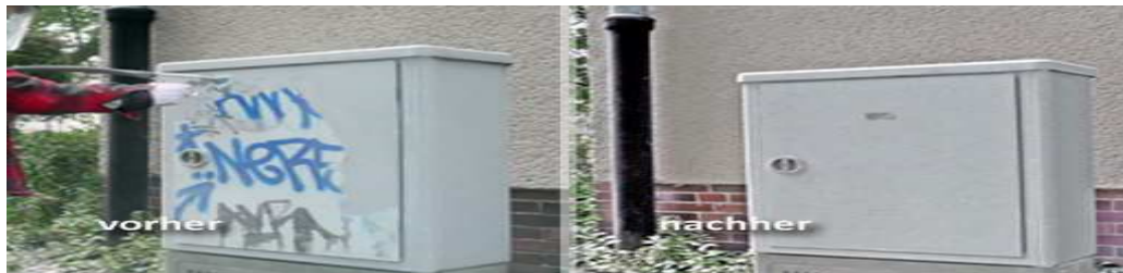
Graffiti- und Flächenschutz