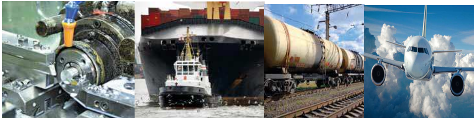
in der Industrie

Industrie Bausektor Gastronomie Privat Medizin Luftfahrt Solarmodule Nautik