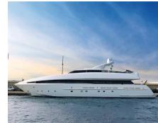
Yachten + Segelboote